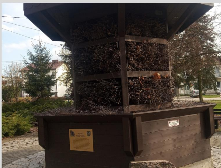
Tężnia na rynku w Łaskarzewie. Miejsce spotkań mieszkańców.