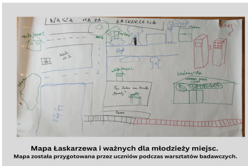
Mapa Łaskarzewa i ważnych dla młodzieży miejsc. Mapa została przygotowana przez uczniów podczas warsztatów badawczych.