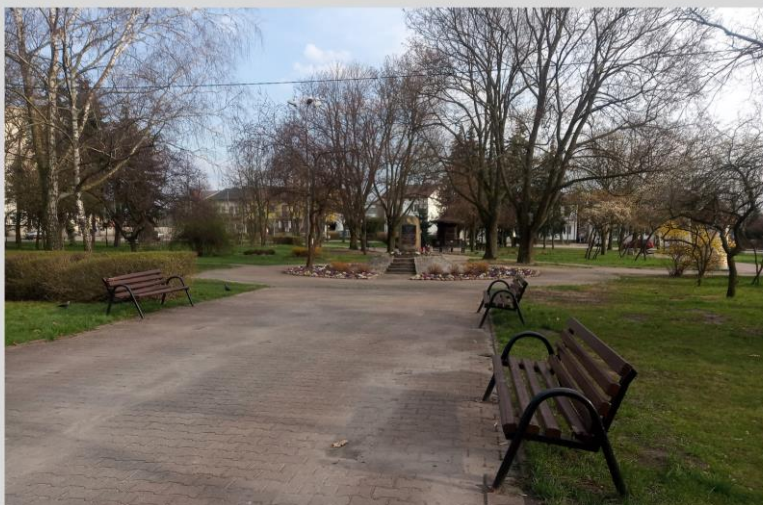
Rynek w Łaskarzewie. Miejsce spotkań mieszkańców. Na środku widoczny pomnik upamiętniający rocznicę nadania praw miejskich.