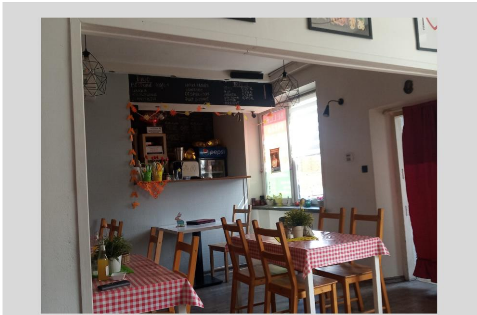
Wnętrze pizzeri Bella. Jedno z niewielu miejsc, gdzie młodzież może się spotkać.

wybuch wojny w Ukrainie i konieczność zakwaterowania w siedzibie CIA uchodźców i uchodźczyń, ograniczyły możliwość prowadzenia działań dla młodych, ale też możliwość spędzania tam czasu.